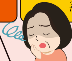
年代別 歯を失う平均の本数